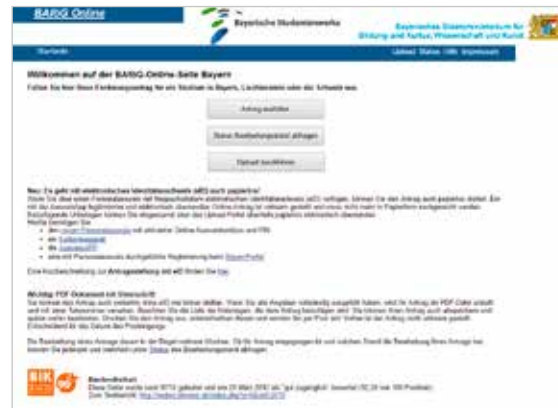
Screenshot des BAföG-Online-Portals

Die Website führt Sie Schritt für Schritt durch den gesamten Antrag und hilft Ihnen beim Ausfüllen: