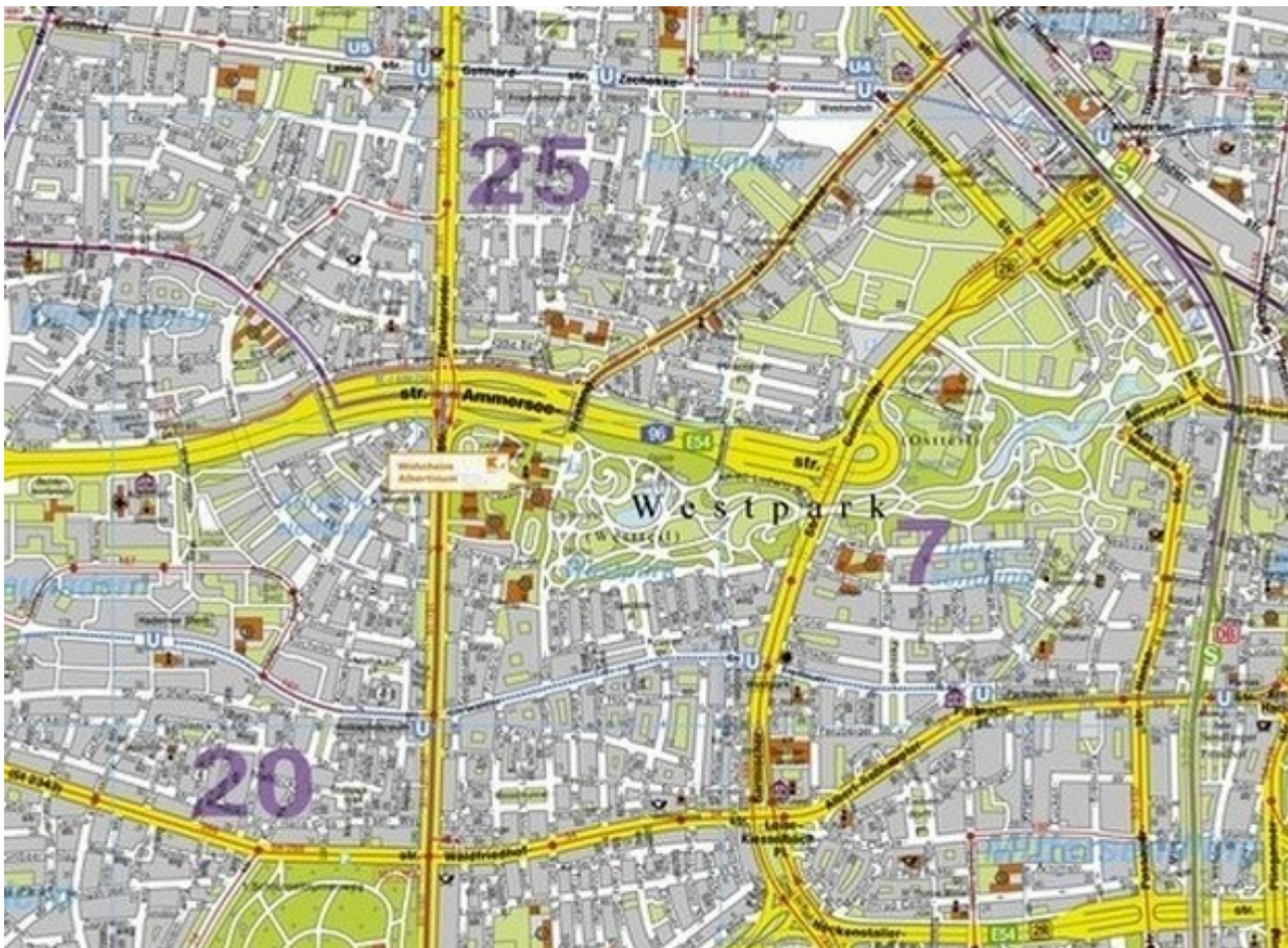
Abbildung 1: Umgebungsplan Wohnanlage Albertinum

In der Nähe der Anlage gibt es gute Einkaufsmöglichkeiten und Restaurants. Der Westpark, der direkt neben der Wohnanlage beginnt, lädt zu Erholung und Freizeitgestaltung im Grünen ein (Veranstaltungen auf der Seebühne, Biergarten, Open Air Kino im Sommer).