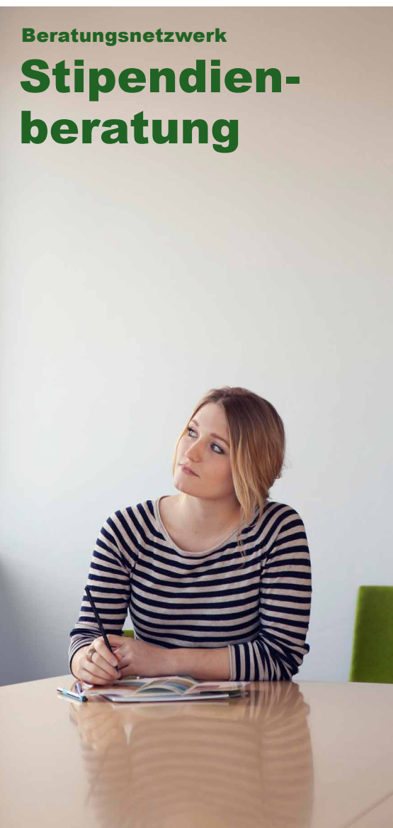
Stand: April 2017

Dienstag 10.00 – 12.00 Uhr Donnerstag 14.00 – 16.00 Uhr